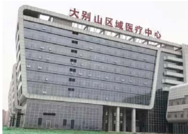
黄冈“小汤山”医院——大别山区域医疗中心

因抗疫有力、表现突出，被广东省工信厅列为疫情防控重点保障企业，并获广东省工商联通报表扬，被授予“抗击疫情优秀民营企业”荣誉称号。