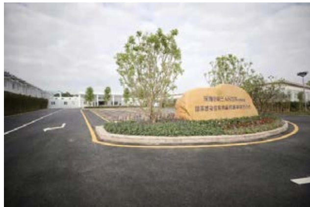
深圳应急医院——深圳市第三人民医院二期工程应急院区