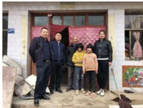
河北校友联络处赴宕昌考察调研