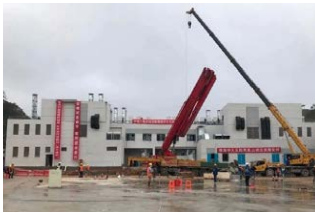
珠海应急医院——中山大学附属第五医院凤凰山院区