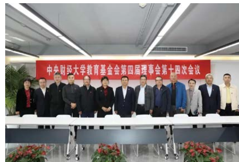
理事会、监事会成员合影