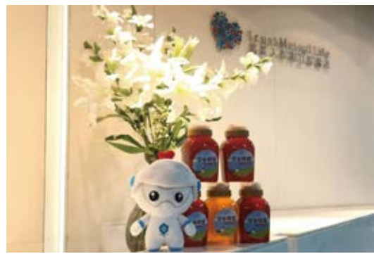
校友企业信美相互大力支持脱贫攻坚、积极采购宕昌产品