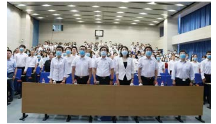
师生在学院南路校区学术会堂报告厅收看庆祝大会

庆祝中国共产党成立 100 周年大会引发中财大师生热烈反响。百年征程波澜壮阔，百年初心历久弥坚。“我们要继续弘扬光荣传统、赓续红色血脉，永远把伟大建党精神继承下去、发扬光大！要以实现中华民族伟大复兴为己任，增强做中国人的志气、骨气、底气，不负时代，不负韶华，不负党和人民的殷切期望”成为大家共同的心声。