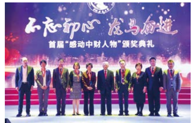
校党委书记何秀超与当代中国著名法学家和法学教育家，新中国刑法学的主要奠基者和开拓者，中国国际刑法研究开创者，“人民教育家”国家荣誉称号、“最美奋斗者”荣誉称号获得者高铭喧教授一同为金融学慕课团队颁奖