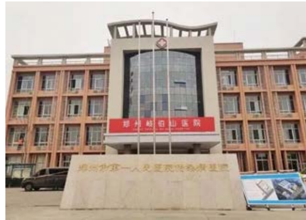
郑州“小汤山”医院——郑州岐伯山医院