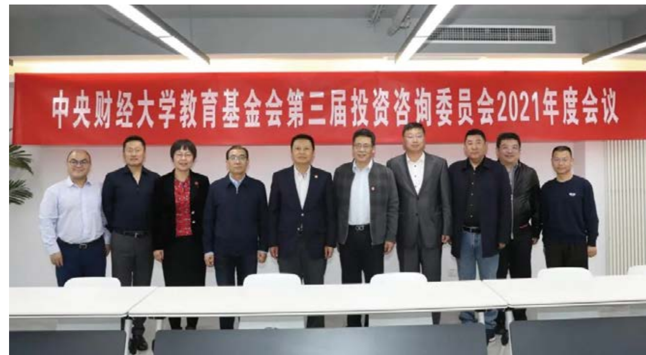
参会人员合影留念