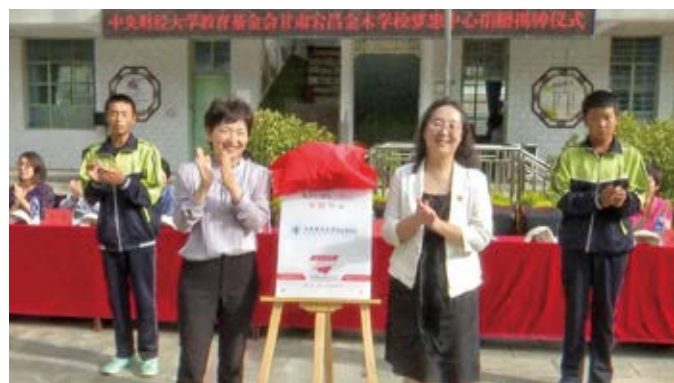
梦想中心揭牌仪式