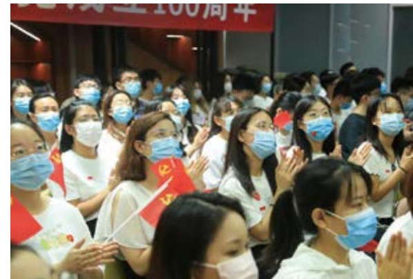
师生在沙河校区大学生活动中心收看庆祝大会

在学院南路校区学术会堂 402 报告厅、202 报告厅，沙河校区大学生活动中心 103 报告厅，千余名师生集体收看“庆祝中国共产党成立 100 周年大会”现场实况直播。学校党外人士也同时在学术会堂 604 会议室集中收看。在两校区餐厅等公共区域的电视机旁，也聚集了许多前来收看直播的师生员工。各单位还组织师生自发收看。