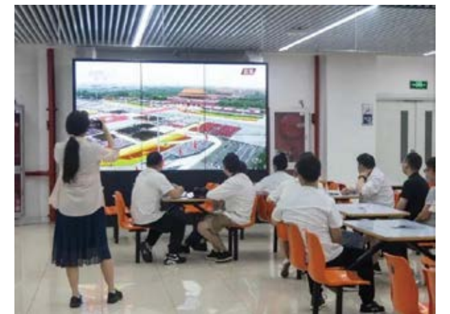
师生员工在食堂公共区域收看直播

庆祝大会后，60 余位党内先进典型代表、乡村振兴一线代表、新党员代表、党政干部、专任教师、辅导员、团干部、学生代表以及民主党派和无党派人士，召开学习领会“习近平总书记在庆祝中国共产党成立 100 周年大会上的重要讲话精神”专题座谈会，畅谈收听收看感想。