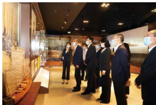
参观招商局历史博物馆