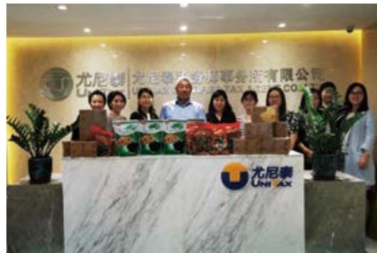
校友企业尤尼泰大力支持脱贫攻坚、积极采购宕昌产品