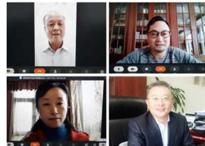
校友组织和校友企业代表纷纷响应

母校大力动员，校友全力以赴，以消费带动扶贫，将爱心融入宕昌。全球校友、校友企业、校友组织大力支持，通过“e帮扶”等平台购买宕昌扶贫产品，引导社会消费390余万元，超额完成“百万消费扶贫计划”。