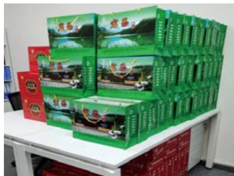
校友企业龙马资本大力支持脱贫攻坚、积极采购宕昌产品