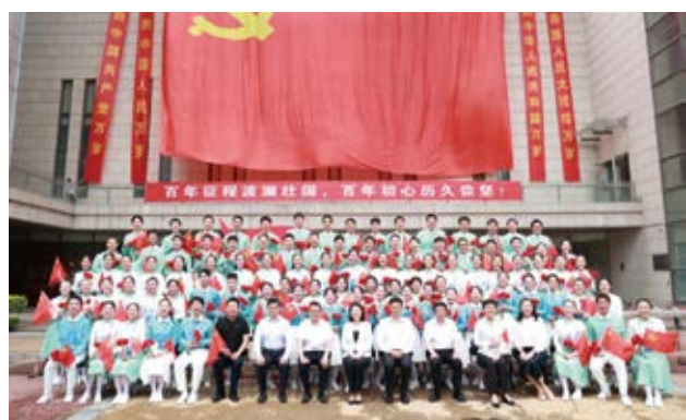
学校领导与天安门广场专项活动的师生们合影

此次活动作为中财大党史学习教育的一项重要安排，旨在深入学习习近平总书记在庆祝中国共产党成立 100 周年大会上的重要讲话精神，深刻领会、准确把握重要讲话的重大意义、科学内涵、精神实质、实践要求，不断推进学校党史学习教育走深走实，激励动员广大师生员工爱党、敬党、颂党，筑牢“永远跟党走”信仰信念，积极服务学校事业发展，投身全面建设社会主义现代化国家新征程。