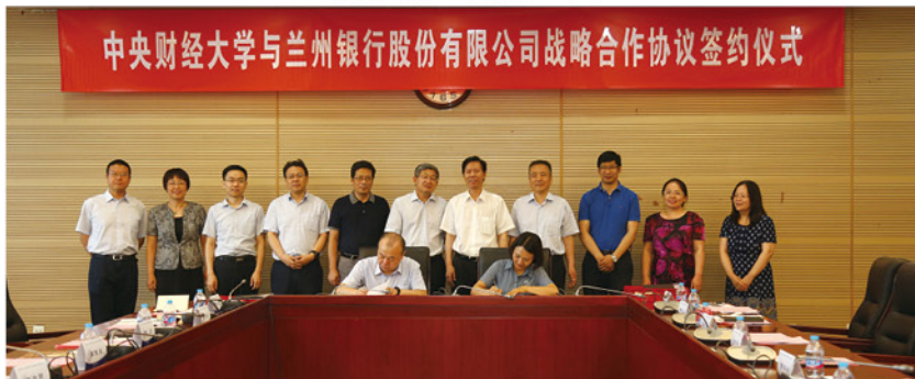
双方签署捐赠协议