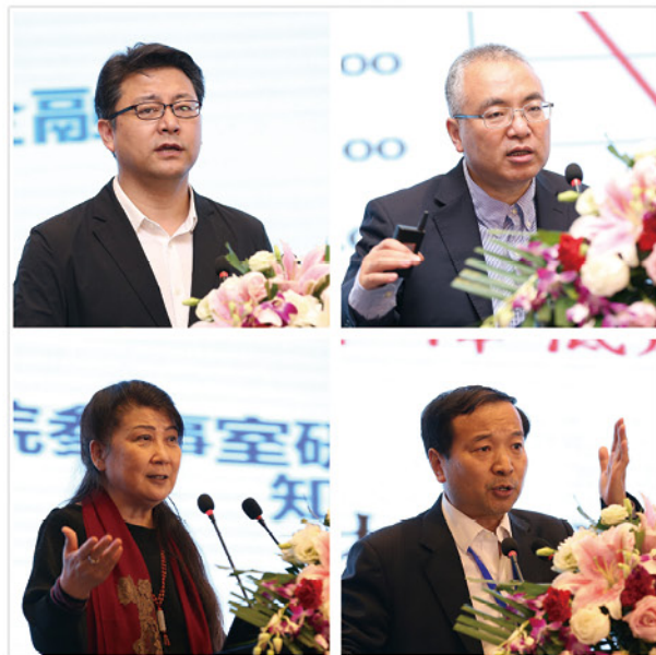
金融科技未来发展趋势展望主题演讲