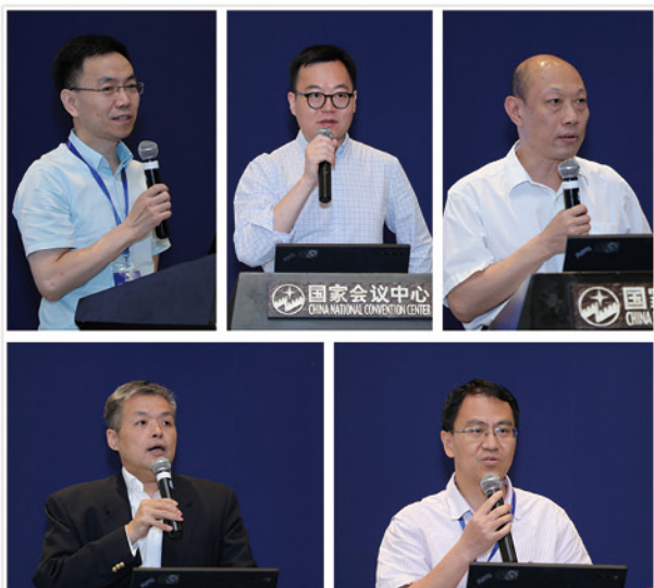
金融科技、监管科技与学科建设主题演讲

长王广谦教授、京东集团副总裁郑宇、麦肯锡全球董事合伙人周宁人、中国建设银行建信金融科技有限公司副总裁姜俊、中国工商银行副行长李云泽、CWM50 学术主席、全国社保基金原副理事长王忠民从金融科技对社会的影响、金融科技的未来发展、金融科技的应用与前沿，以及金融科技与监管等方面深入解读了金融科技的现状与未来。