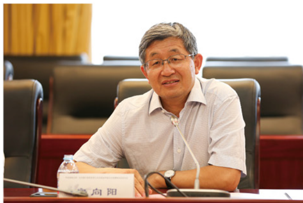
房向阳董事长致辞