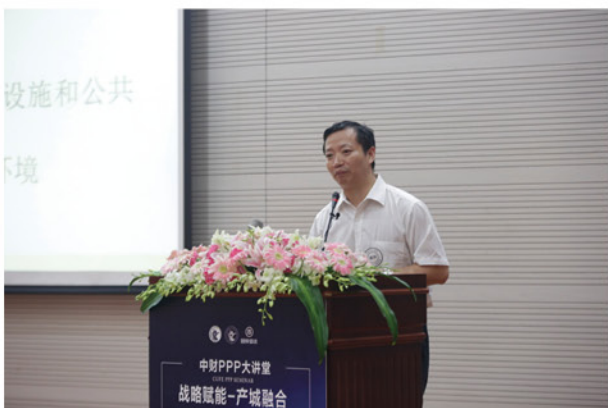
国家发展改革委投资研究所体制政策研究室主任吴亚平做主题演讲