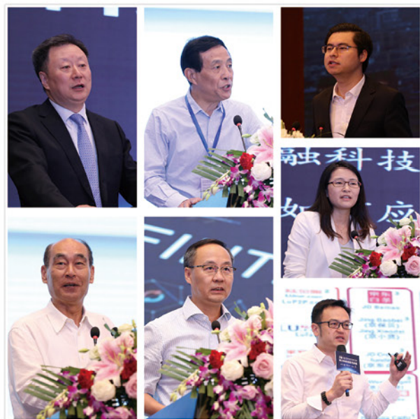
“金融科技理论研究与应用实践”的主题演讲