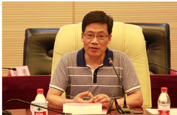
史建平副校长致辞