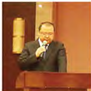
苏中行长助理致辞