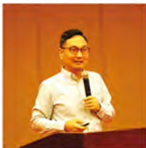
雷杰校友主题演讲