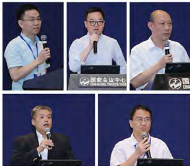
金融科技、监管科技与学科建设主题演讲

术研究方向与学科建设6场圆桌讨论，来自商业银行、高等院校、金融管理机构、非银行金融机构等与会专家和学者就相关话题进行了深入的讨论和交流。