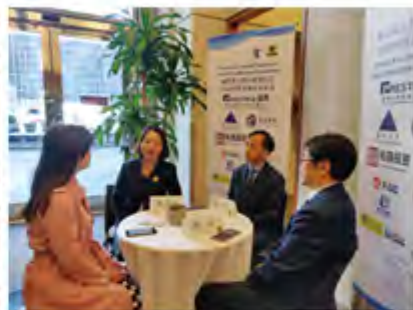
会议间歇接受新闻媒体采访