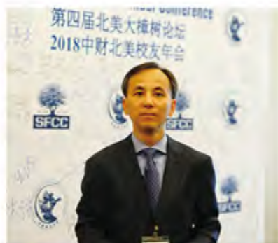
刘军代总领事在论坛上致辞