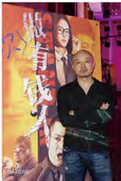
冯万里，我校国资 94 级杰出校友，著名电影导演、编剧

年轻的日子真是上天给每一个人最好的礼物。在那些日子里，我们都足够独一无二，做着只属于自己的梦；我们也足够孑然一身，倾其所有，只为了那个小小的梦。——题记