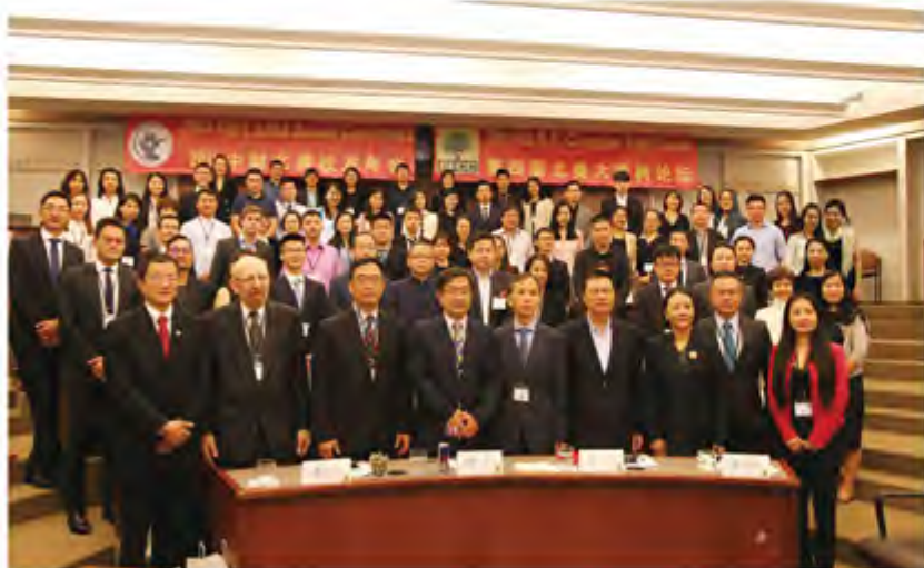
参会者及嘉宾合影留念

2018年9月22日至23日，我校2018北美校友会2018年年会暨第四届北美大樟树论坛在芝加哥大学布斯商学院（University of Chicago Booth School of Business）成功举办。近百名来自美国各地、加拿大以及来自母校和国内的校友和校外友人齐聚芝加哥河畔，共襄年会和论坛。