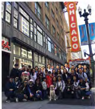
中财学子建筑之旅至芝加哥标志性建筑芝加哥大剧院前合影