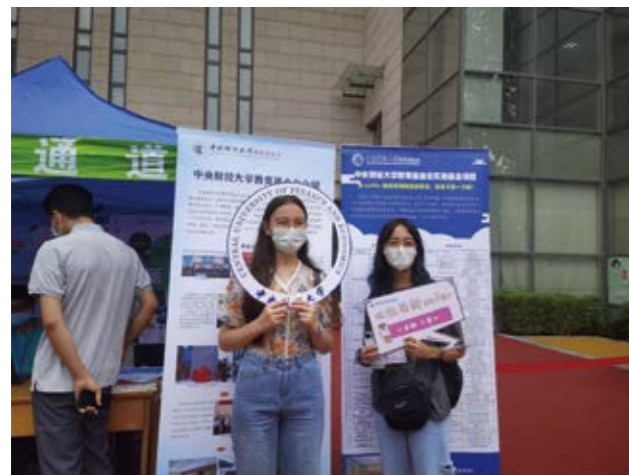
记录新生与教育基金会的初次遇见