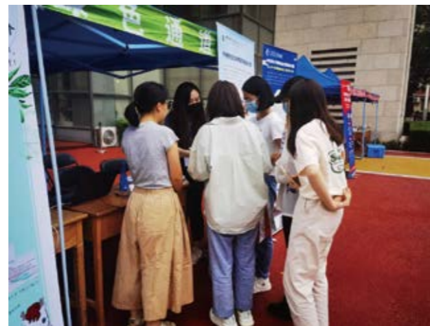
介绍教育基金会特色项目及活动

在迎新现场，还有部分校园卡余额捐赠活动的受益同学，他们对校园卡余额捐赠活动有了更加深入的了解，也对师兄师姐的爱心表示诚挚的感谢。