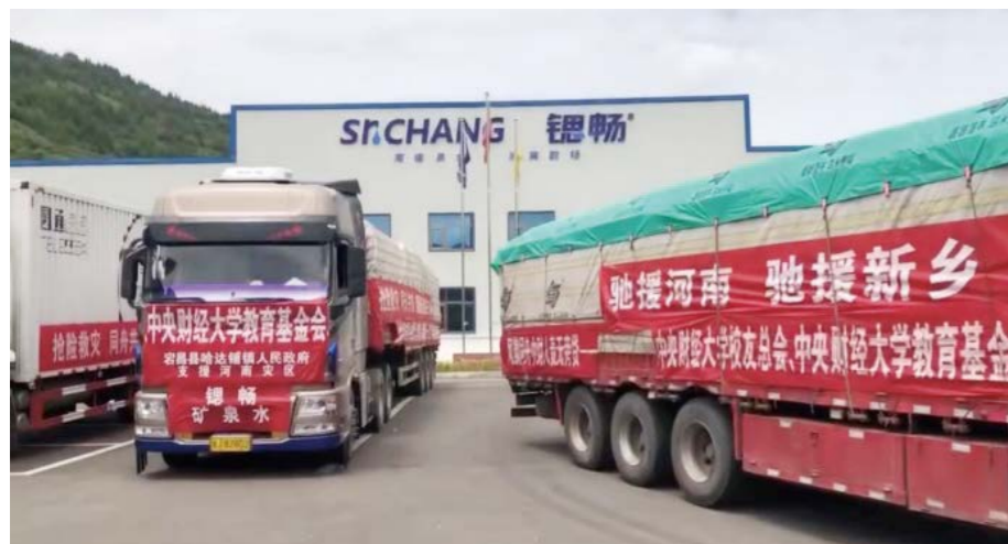
“风豫同州” 捐赠 10000 箱、24 万瓶饮用水驰援河南

7月27日，中央财经大学校友总会、教育基金会捐赠饮用水驰援河南发车仪式在甘肃省宕昌县哈达铺镇玉岗村举行。我校党委副书记梁勇，校友总会、教育基金会秘书长葛仁霞，宕昌县委副书记县长何玉柏、于文豪，甘肃圆通速递有限公司总监朱龙藤等出席仪式。