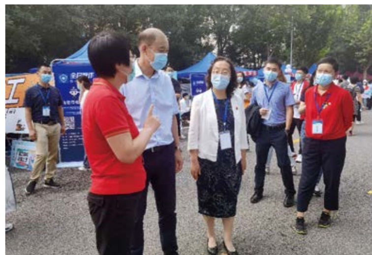
校领导了解教育基金会迎新宣传情况

两会秘书处的工作人员与志愿者团队各司其职，恪尽职守，向新生认真耐心地解答关于教育基金会的各种问题，包括教育基金会的职能作用、奖助学金种类、项目申请条件等。每一次提问与回答，都让新生感受到来自教育基金会的无微不至与周到服务。除此之外，精心准备的手持拍照板，记录萌新们与中财大教育基金会的第一次遇见；各式各样的明信片，鼓励大家好好感受初入大学校园的心情，对父母家人、知心好友或是未来的自己书写内心的诚挚祝福与深情话语。