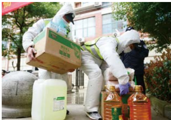
党员抗疫志愿服务队配送物资

战疫检验文明创建成效，多举措服务疫情防控大局。2020年初，面对突如其来的新冠肺炎疫情，天风证券党委火速组建以党员为主的200人志愿服务队，为117家医疗机构捐赠209万件紧缺物资，为7000余名社区困难群众、滞汉人群、福利院老人捐赠防疫与生活物品，为数万名医护人员提供生活关怀。天风证券党员抗疫志愿服务队获评中华人民共和国民政部“中华慈善奖·慈善楷模”。