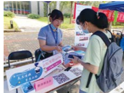
向新生赠送明信片