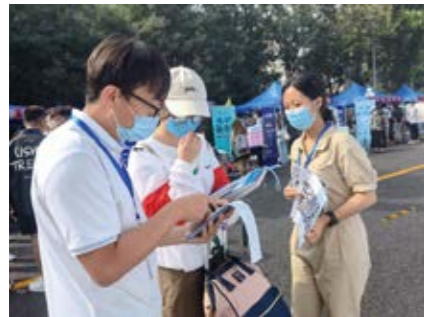
介绍奖助学金项目