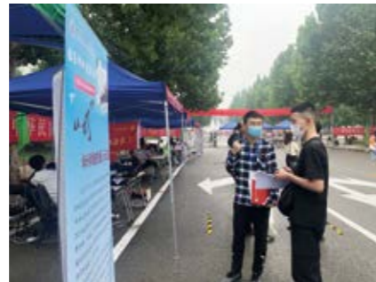
介绍校园卡余额捐赠活动