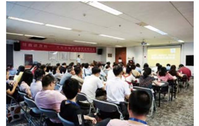
投资者教育进高校

近年来，天风证券按照中央和省市区精神文明建设工作要求，坚持改革创新、务实创建，努力推动精神文明建设取得新发展、新跨越。