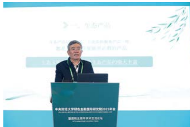
杨伟民：健全生态产品价值实现机制实现生态文明

成果。希望绿金院再接再厉，加强团队建设、强化政策标准研究、推动成果应用与转化、深化国际合作，为绿色金融理论与实践做出更大贡献。展望未来，何书记指出，绿色金融是一份功在当代、利在千秋的伟大事业，希望绿色金融相关各方充分抓住绿色投融资机遇，助力中国“2030 碳达峰、2060 碳中和”目标的实现；积极开拓绿色金融工具与专业技术，推动我国实体经济结构向绿色低碳转型；加强绿色金融及可持续发展的国际交流合作，坚持构建国内国际双循环新发展格局，讲好绿色金融“中国故事”，携手推进可持续发展，共建生态文明和美丽地球。