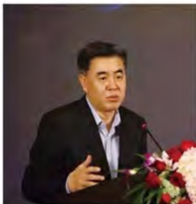
苑广睿：全国人大代表，我校经济博 99 级杰出校友，天津市财政局（天津市地方税务局）局长。

就财政系统如何推进京津冀协同发展重大国家战略，苑广睿代表认为：发挥政策资金引导作用，为交通互联互通提供保障。苑广睿代表说，要加快港口机场基础设施和航空物流区建设，推动京滨、京唐铁路等重点工程，实施一批国省干线提级改造，推进京滨城际全线开工，扎实做好津保忻、津承铁路前期工作。