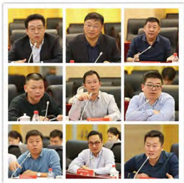
各位委员建言献策

业全面、独立客观的工作态度表示由衷的感谢，并希望大家能继续坚持，继续为母校教育基金会的发展贡献智慧和力量。