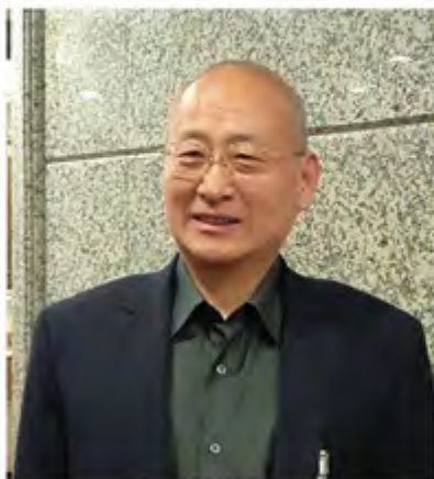
牛锡明：全国政协委员，我校金融79级杰出校友，曾任交通银行党委书记、董事长、执行董事。

牛锡明委员认为，目前银行资产质量基本真实，不良贷款风险可控。牛锡明委员也谈道，金融乱象和“脱实向虚”的问题对中国的经济是有伤害的。金融乱象必须治理，中央现在出手来治理金融乱象，要求银行不要“脱实向虚”，聚焦实体经济，这些政策和措施都非常正确。一行三会在治理金融乱象方面采取的措施已经开始显现效果。