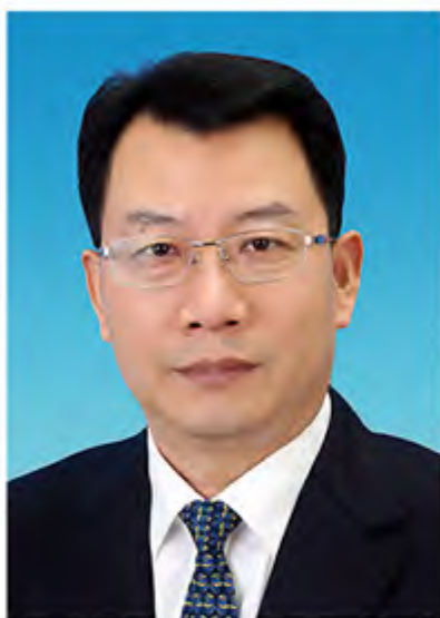
冀国强：全国政协委员，我校财政84级杰出校友，天津市委常委、统战部部长。

冀国强委员等住津全国政协委员在联名提案中，建议水利部等国家部委加快实施南水北调东线二期工程建设，实现东线向京津冀地区供水，保障区域用水安全。