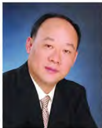
蓝逢辉：全国政协委员，政协第十三届全国委员会经济委员会委员，我校税务 87 级杰出校友，中国注册税务师协会副会长，四川新联会会长，尤尼泰税务师事务所有限公司总裁。

蓝逢辉委员表示，总书记在联组会上说“中共十八大以来的 5 年是极不平凡的 5 年”，这让我感触很深。作为全国政协委员，这几年，我亲眼见证了在中国共产党的坚强领导下，我国取得的巨大成就，实实在在地解决了许多长期想解决而没有解决的难题，办成了许多过去想办而没有办成的大事。在国内，全方位、开创性的发展成就和深层次、根本性的发展变革；在国际上，我国走近了国际舞台的中央，地位和作用越来越凸显。全面体现了中国真正强起来。作为一名中国人，我感到无比自豪。