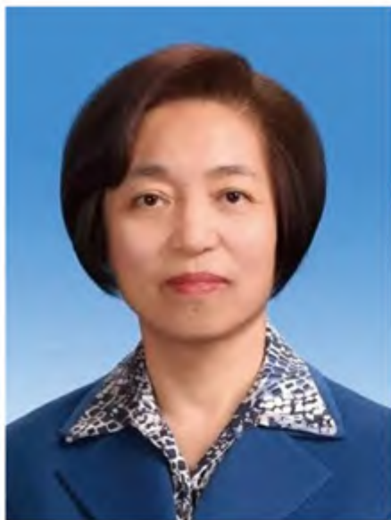
苏辉：十三届全国政协副主席，我校财政78级杰出校友，台盟第十届中央委员会主席，全国台联副会长。

在接受中评社中评网记者专访时，苏辉副主席表示，台盟与台湾同胞有天然的亲情和乡情联系。台湾是我们每一位台盟盟员魂牵梦绕的故乡，推动两岸交流，共图民族伟大复兴是我们一以贯之的历史职责，也是我们矢志不渝的奋斗目标。