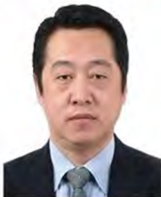
于丕涛：全国人大代表，我校财政79级杰出校友，国家开发银行安徽省分行行长。

美好生活需要完善的法治进行保障，随着全面依法治国的推进，老百姓对法律知识的需求呈现出范围更广、专业性更高、针对性更强的特点。开展形式多样、通俗易懂、与时俱进的法治宣传教育，成为十三届全国人大一次会议安徽代表团诸多代表的心声。