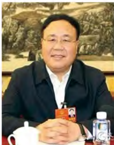
张智军：全国人大代表，我校会计 83 级杰出校友，甘肃省财政厅厅长。

张智军代表认为甘肃在政府采购信息公开、提高采购过程透明度方面的做法有三点：一是加大甘肃政府采购网建设力度；二是严格政府采购信息公开制度的执行；三是建设完善信息系统以规范公开工作。