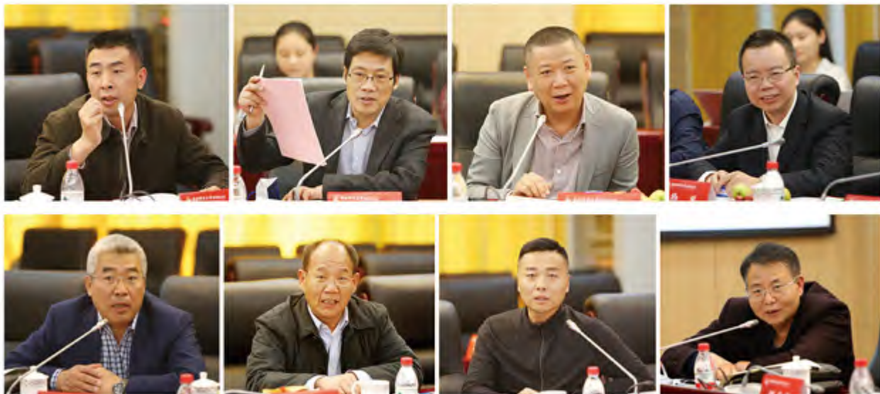
基金会各位理事、监事发言

算安排，以及基金会2018年奖助基金项目资助计划、2018年投资计划、投资收益结转、《中央财经大学教育基金会重大事项报告制度》修订等议案的汇报。理事会逐一进行了认真审议并投票一致通过了各项议题。