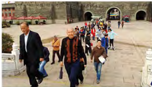
参观中央电视台南海影视城