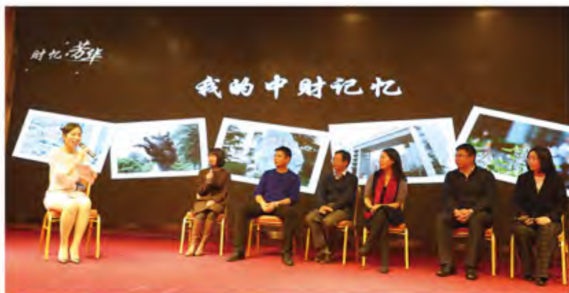
“我的中财记忆”主题分享

互助前行的理念，在全体会员的共同努力下，把金融俱乐部建设成为一个产融结合、资源共享、互助共荣的优秀而温暖的家。