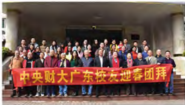
2018年广东校友会迎新年团拜会大合影