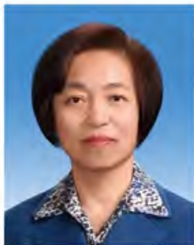
苏辉 全国政协委员 全国政协副主席 我校财政 78 级杰出校友 台盟第十届中央委员会主席 全国台联副会长

2018 年 3 月 14 日，全国政协十三届一次会议举行第四次全体会议，选举政协第十三届全国委员会主席、副主席、秘书长和常务委员。中央财经大学财政 78 级杰出校友苏辉当选全国政协副主席。