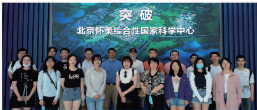
团队教师带领本硕博学生调研北京怀柔综合性国家科学中心