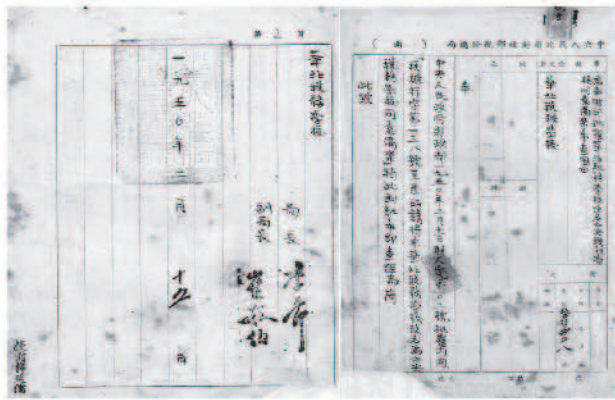
财政部同意华北税务学校改名为中央税务学校的批文

新中国成立之前中央就决定办一所税务学校，因为解放战争时期，我们的财政经济比较困难，主要靠税