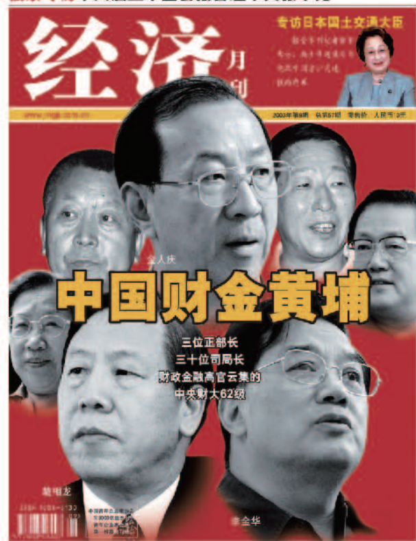
《经济》杂志开设专栏介绍中财大六二级金融班的丰硕成果