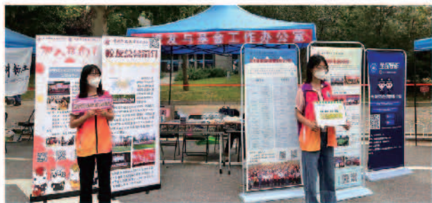
沙河校区迎新宣传展台