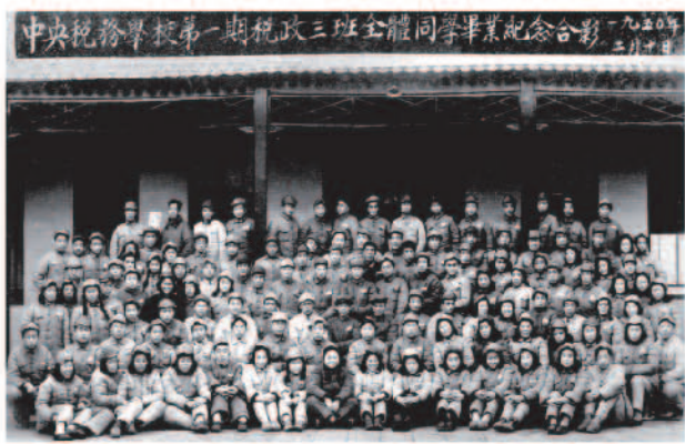
1950年中央税务学校第一期税政三班全体同学毕业合影

在12月15日的时候，他们正式开学，在开学典礼上，首任校长作了激情洋溢的演讲，号召同学们团结一致，喜欢学习。他还解释了校训“忠诚朴实、廉洁勤能”八个字的含义：第一忠诚，对人们事业无限忠诚，对革命一条心；第二朴实，是革命的优良传统，必须发扬；第三廉洁，税收是与各个阶层相接触的，而且与钱联系，很容易犯错误，必须保持廉洁；第四勤能，必须勤恳工作，提高效能，这样才能贯彻政策。这是学校对学员的要求，也是党对学员的要求。税校的学院入校伊始，校长就把这些传导给他们，这不仅是税校的第一堂课，更是中财历史上的浓墨重彩的一笔。