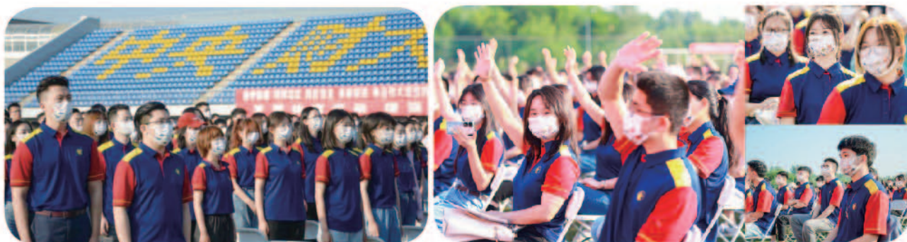
2022级新生开学典礼现场

弦歌不辍，芳华待灼，莘莘学子，相聚一堂。9月16日上午，我校2022级新生开学典礼在沙河校区隆重举行。沐浴着金秋的晨光，全体新生身着校友捐赠，寓意“红色基因、筚路蓝缕、财经黄埔”精神的“红蓝黄”主题文化衫，队列整齐，精神饱满，携着十足的朝气，踏着振奋的乐声，在师长、亲友和校友的共同见证下，迎来启航人生的新时刻，翻开追逐梦想的新篇章！