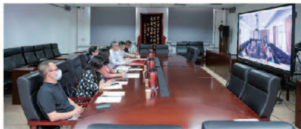
会议现场（中央财经大学）

7月9日，我校国际经济与贸易学院对口援建新疆财经大学国际经贸学院合作协议签约仪式暨“一带一路”与中国外贸高质量发展学术论坛如期举行。