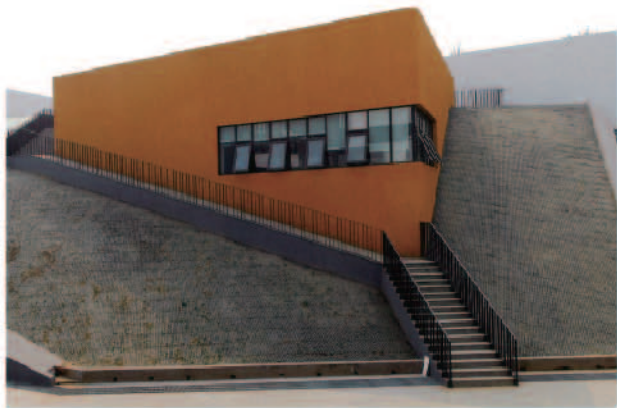
沙河校区学生活动中心

来到之后，不少同学抱怨：路好难走，天气太恶劣……不少的学长学姐就安慰我们说：“你们已经够幸福的啦！我们来的时候（2009年夏天），就只有几路公交，连地铁也没有。你们现在有那么多路公交，还有地铁，出行比我们好多了。中财现在虽然在施工，但是我们那会儿，全是土路，一走路，那些灰尘简直没法忍受。现在都硬化了，已经很好了。天气恶劣就忍着点吧。毕竟自己已经选择了北京--北京的天气、环境能和你们的家相比吗？”