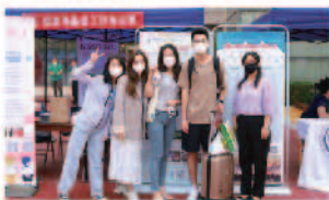
与收到短信的同学合影