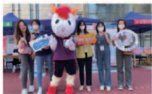
学院南路校区工作人员合影