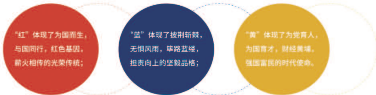
寓意“红色基因、筚路蓝缕、财经黄埔”精神的“红蓝黄”主题文化衫

今年的“红蓝黄”文化衫由我校校友通过母校教育基金会支持捐赠，校友与基金工作办公室（校友总会秘书处、教育基金会秘书处）传递校友情，发放给每位22级新同学。一件衣服虽小，但它蕴含着“红色基因、筚路蓝缕、财经黄埔”的中财大精神，寄托着学校对学生成为自信昂扬、自立自强、担当有为的中财大人的殷切期盼，传递着校友对学弟学妹们坚定信念、勇敢前行、成长成才的美好祝愿。