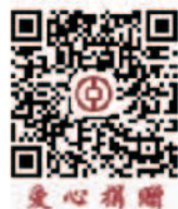
“财经人·济世路”项目

“高校公益周”活动虽已落幕，爱心汇聚仍在继续！捐款渠道将继续为更多的善意开放，至2023年10月31日有效。欢迎您的爱心关注和捐赠！