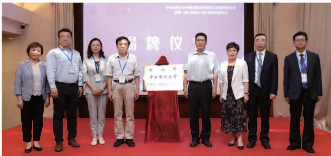
中国健康保障创新实验室揭牌