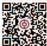
扫码查看公募活动详情

最后，自强是助强的基础，助强是自强的动力。让贫寒学子们在助强班中不断自强，这或许就是助强班的最本质意义。