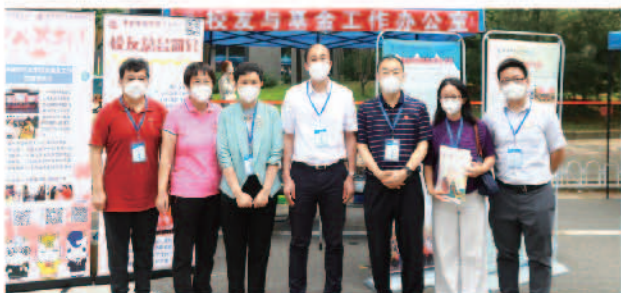
何秀超书记一行走访迎新现场

校党委书记、教育基金会理事长何秀超，校长、校友总会会长王瑶琪等领导来到迎新现场欢迎2022级新同学，并亲切慰问服务在迎新一线的师生，了解校友与基金工作办公室迎新宣传情况。