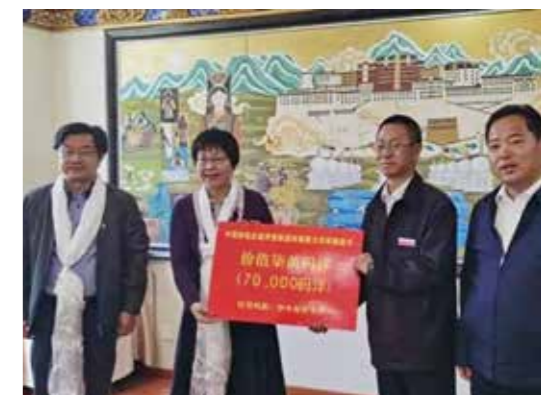
举行图书资料捐赠仪式