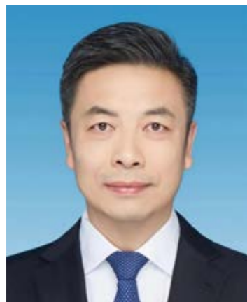
任珠峰 金融 89 级校友

3月26日，江西省第十三届人民代表大会常务委员会第二十八次会议，决定任命我校金融 89 级校友任珠峰为江西省人民政府副省长。