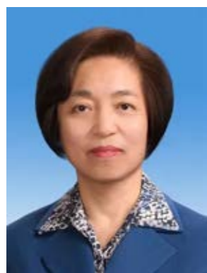
苏辉，我校财政78级校友，台盟中央主席，全国政协副主席。

全国政协领导同志于3月5日分别在全国政协十三届四次会议有关界别与委员们进行讨论。今年是中国共产党成立100周年，也是“十四五”的开局之年。会上，全国政协副主席、台盟中央主席苏辉表示要加强两岸交流，增进两岸同胞友好关系。