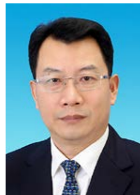
冀国强，我校财政84级校友，天津市委常委、统战部部长，全国政协委员。

2021年初，党中央印发了新修订的《中国共产党统一战线工作条例》（以下简称《条例》）是新时代统一战线工作的基本遵循。《人民政协报》“奔向新征程”专栏采访了全国政协委员，中共天津市委常委、统战部部长，我校财政84级校友冀国强。冀国强表示，《条例》的修订和实施对于加强党的统一领导，巩固和发展爱国统一战线，全面建设社会主义现代化国家以及实现中华民族伟大复兴的中国梦具有重要意义。