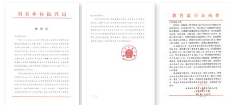
感谢信原文扫描件

近日，国家乡村振兴局向我校发来感谢信，向学校在助力脱贫攻坚中的辛勤付出和突出贡献表示感谢。同时，教育部脱贫攻坚工作领导小组办公室也致函我校，肯定我校的定点扶贫工作，感谢我校对甘肃省宕昌县脱贫攻坚所做的贡献。