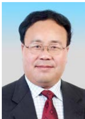
张智军，我校会计83级校友，甘肃省财政厅党组书记、厅长，全国人大代表。

受国务院委托，财政部3月5日提请十三届全国人大四次会议审查《关于2020年中央和地方预算执行情况与2021年中央和地方预算草案的报告》。面对该预算报告，全国人大代表，甘肃省财政厅党组书记、厅长，我校会计83级校友张智军发表了自己的见解。