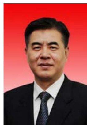
苑广睿，我校经济博99级校友，天津市发展和改革委员会副主任，全国人大代表。