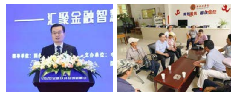
财政 98 级校友、中国银保监会普惠金融部扶贫协调处处长陈元浩

陈元浩校友作为中国银保监会普惠金融部扶贫协调处处长，全力抓好银保监会牵头的扶贫小额信贷工作，为解决贫困群众融资难融资贵问题发挥了重要作用；大力推进银行业保险业扶贫工作，全面超额完成任务目标；认真做好银保监会定点扶贫工作，4 个定点扶贫县在 2019 年前全部脱贫摘帽。