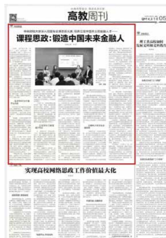
《中央财经大学深入挖掘专业课思政元素，培养立足中国本土的金融人才——课程思政：锻造中国未来金融人》 《中国教育报》记者 张滢

11月16日，《中国教育报》高教周刊头条刊发了题为《中央财经大学深入挖掘专业课思政元素，培养立足中国本土的金融人才——课程思政：锻造中国未来金融人》的文章，深度报道我校金融学院“课程思政”教学改革成效。