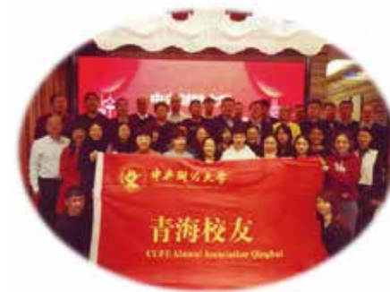
青海校友联络处迎新合影

终沿着母校“忠诚、团结、求实、创新”的校训，不断发展壮大。现今新鲜血液的汇入，让联络处更加充实、更加美好！总有一种力量温暖着前路，那就是母校的力量、校友的力量！