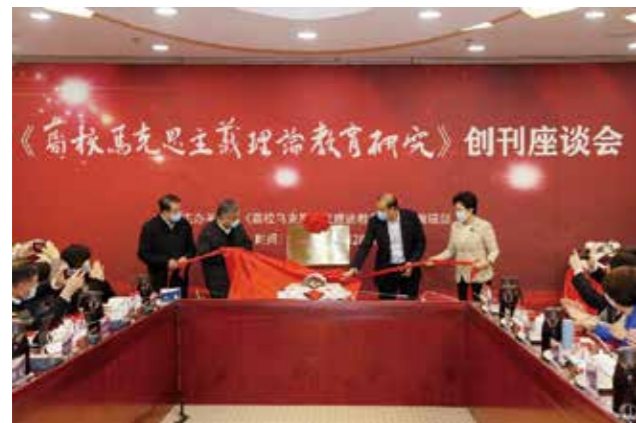
《高校马克思主义理论教育研究》编辑部揭牌