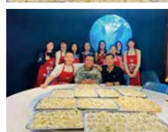
深圳校友联络处迎新合影

为了欢迎2020届来深毕业生加入深圳校友大家庭，促进新老校友相识相知，增强组织凝聚力，我校深圳校友联络处于2020年12月13日上午10点至下午1点在福田区海游荟主题餐厅成功举办了“包饺子，迎校友，促交流”主题活动，近40位校友热情参与其中。