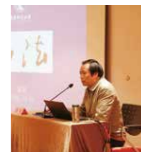
陈明教授书法讲座