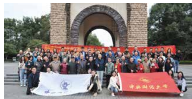
四川校友联络处校友合影

流金岁月，如歌年华。美好的中财大时光，恰似流光溢彩的画卷，烙在我们的记忆深处。10月17日，“喜迎建党100华诞，我与祖国共成长——中央财经大学四川校友联络处2020年会暨年度迎新会”在美丽的天府新区南湖畔隆重举行，100多名校友参加此次联谊会。