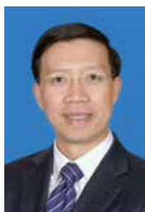
陈忠 货银研 94 级校友

10 月 29 日，榆林市四届人大常委会召开第三十六次会议，会议决定任命我校货银研 94 级陈忠校友为榆林市人民政府副市长。