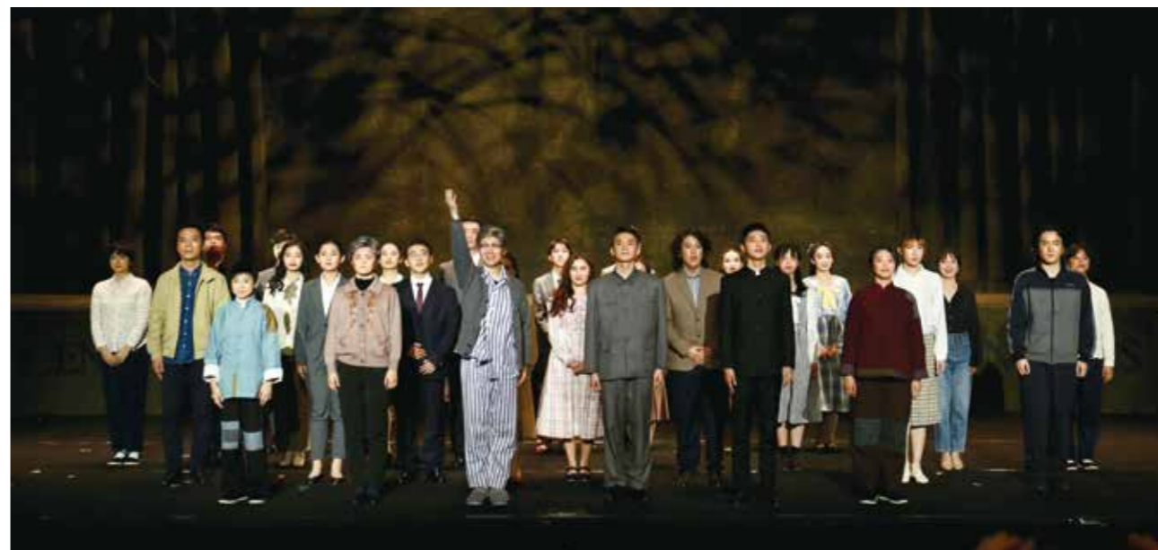
《姜维壮》首演仪式后全体演员谢幕

11月6日，中央财经大学原创大师剧《姜维壮》在学院南路校区学术会堂206报告厅首演，中财大师生以精彩表演向建校71周年献礼，向姜维壮先生致敬。财政部，文化和旅游部有关司局，中国科学技术协会，北京市委教育工委，中国财政科学研究院的领导嘉宾出席首演仪式并观看演出。