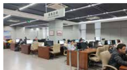
沙河图书馆信息空间