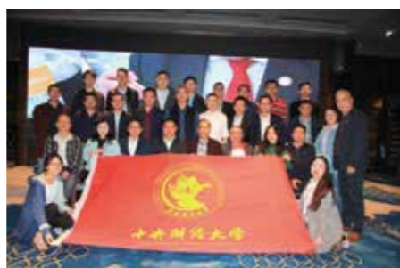
湖南校友联络处聚会合影