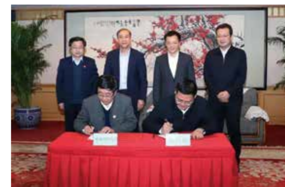
双方签订合作协议

文献在现场讲话中介绍了朝阳区的功能定位和主要优势，表示未来将加大力度发展作为经济产业链条高端的金融业。他表示，朝阳区也将用好发展、政策及国际化优势，努力为学生们提供相关工作实习机会，共同推进人才队伍建设。