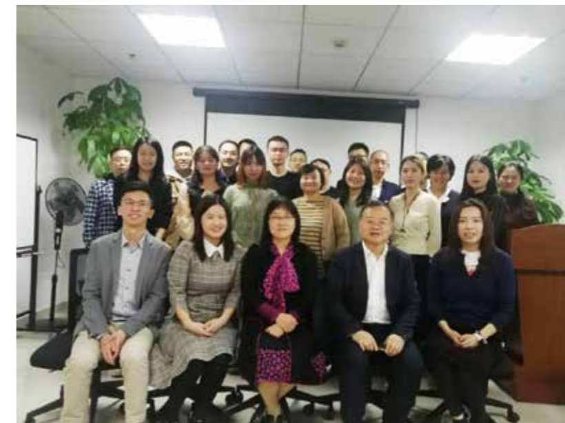
活动组织者与到场嘉宾合影留念