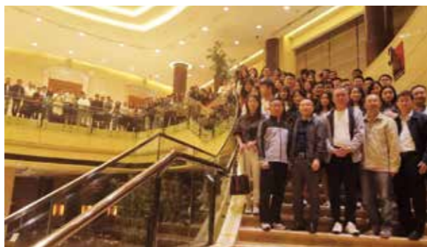
上海校友联络处校友合影

上海校友联络处作为中财大校友们在上海的家，一方面为来沪校友们搭建了相互交流和学习的平台，另一方面也成为了校友们离开学校后寻找初心和归属感的港湾。上