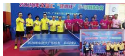
广东校友乒乓球球队合影

为进一步推动全民健身运动深入开展，倡导运动健康防疫抗疫的生活方式，积极推进在粤各高校校友组织文体事业的建设发展，2020年10月18日，广东省文促汇高校文体发展中心在天河体育中心国际乒乓球培训中心举办了第二届“建鸣杯”高校校友组织乒乓球团体赛。来自40所全国在粤高校校友组织的348名乒乓球选手参加了比赛。