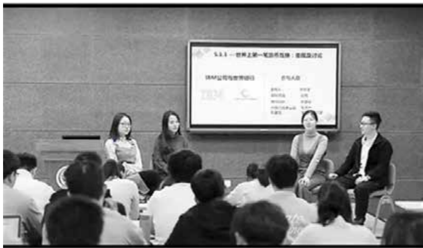
中央财经大学金融学院本科生金融工程概论课程“翻转课堂”活动——学生在重现世界上第一笔货币互换的案例。

在当前党和国家大力推进高校课程思政建设的大背景下,从小处看,怎样才能使专业课教学更好地帮助学生明辨是非,捍卫金融职业伦理?从大处看,如何立足中国特色社会主义金融体制,为党育人、为国育才?自2018年起,中央财经大学金融学院党委深入挖掘专业课“课程思政”元素,从21项课题入手,半数以上教师积极参与,开启了探索之路。