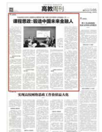
《中央财经大学深入挖掘专业课思政元素，培养立足中国本土的金融人才——课程思政：锻造中国未来金融人》 《中国教育报》记者 张滢

近年来，随着互联网及相关技术的飞速发展，金融行业的商业模式发生巨变，同时也滋生了一些棘手的问题。以往的专业课教学，解决得了知识的难点，但知识背后的价值观涉及得少。要不要对学生进行思想政治教育，进行何种程度的教育，全凭教师个人。