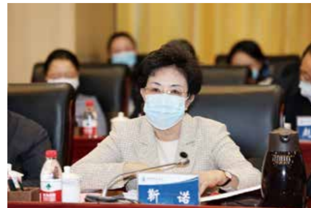
中国人民大学党委书记靳诺讲话

靳诺书记在讲话中指出,《高校马克思主义理论教育研究》的创刊,对深化习近平总书记关于教育的重要论述研究,对推动马克思主义理论教育的交流与合作,促进思政课教师队伍建设有着十分重要的意义。她对办好期刊提出四点期待,即把握好政治性,坚持正确政治方向;把握好学术性,提升学术水平;把握好指导性,助力立德树人;把握好可读性,提高社会影响。