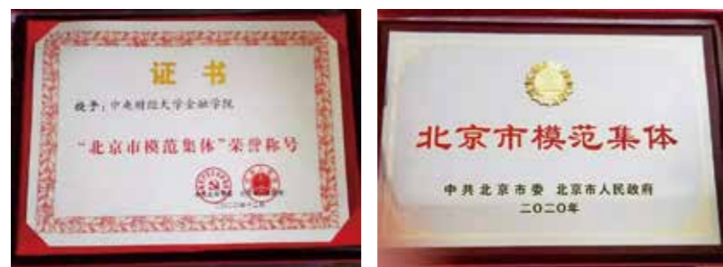
金融学院获得北京市模范集体荣誉证书及奖牌

经过北京市教育工会、北京市总工会、北京市评选表彰委员会严格评审并依照程序公示后，全市教育系统共有 9 个集体、56 名同志被评为