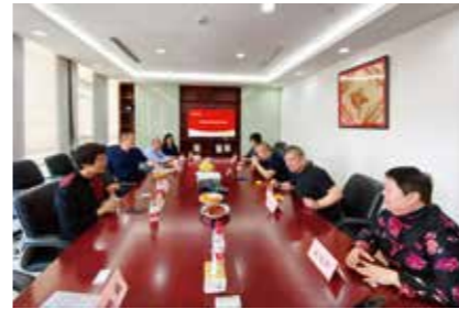
走访涌金集团座谈会现场