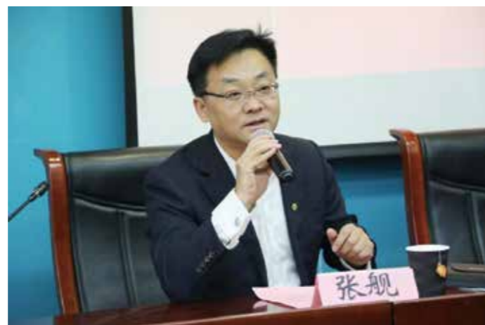
张舰副总经理致辞