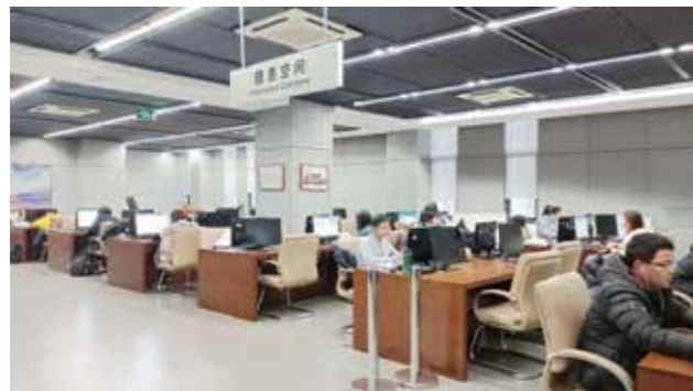
沙河图书馆信息空间